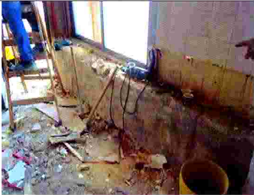
منزل جهاد الصالحي