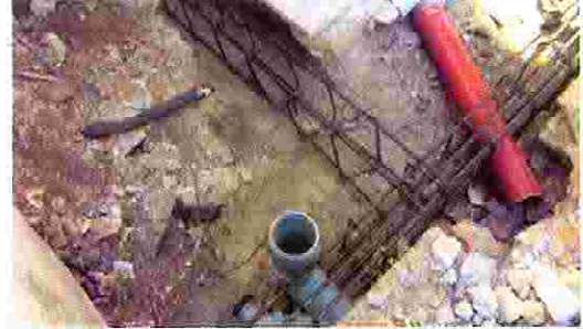
مزل عماد غيث- حوش مزعرو