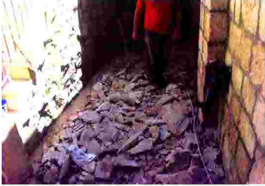
منزل بديعة الطويل