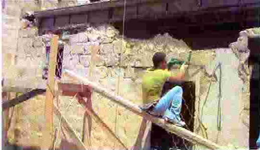
مزل مازن غيث- حوش مزعرو

برنامج الأمم المتحدة الانمائي/ برنامج مساعدة الشعب الفلسطيني