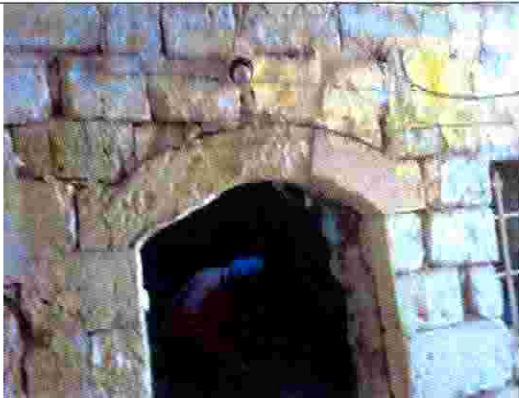
منزل انصاف اسعد