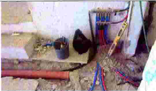
مزل مازن غيث- حوش مزعرو