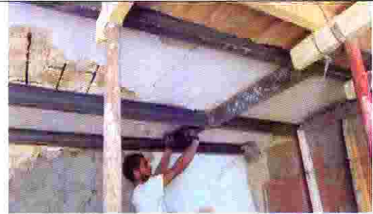
مزل ياسر مزعرو- حوش مزعرو