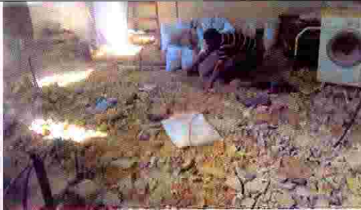
مزل سمير مزعرو- حوش مزعرو