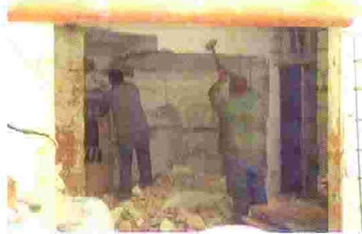
منزل بديعة الطويل