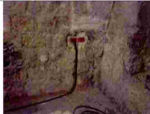
منزل انصاف اسعد