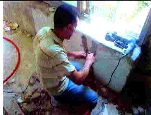
منزل جهاد الصالحي