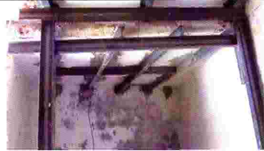
مزل ياسر مزعرو- حوش مزعرو